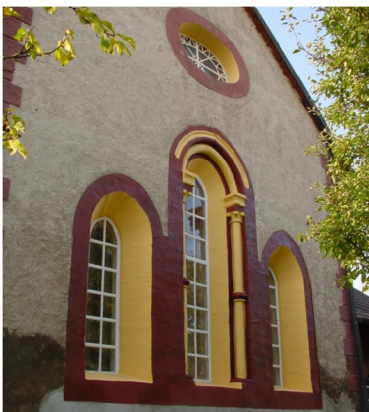
Drei gestaffelte Chorfenster