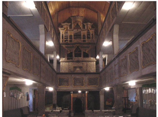
Innenansicht Richtung Kirchenschiff