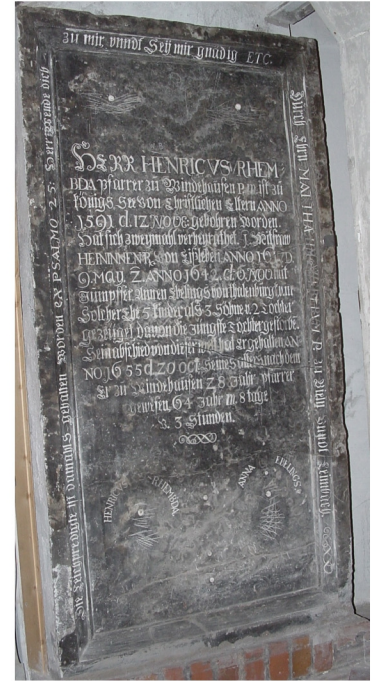
Grabplatte von 1655