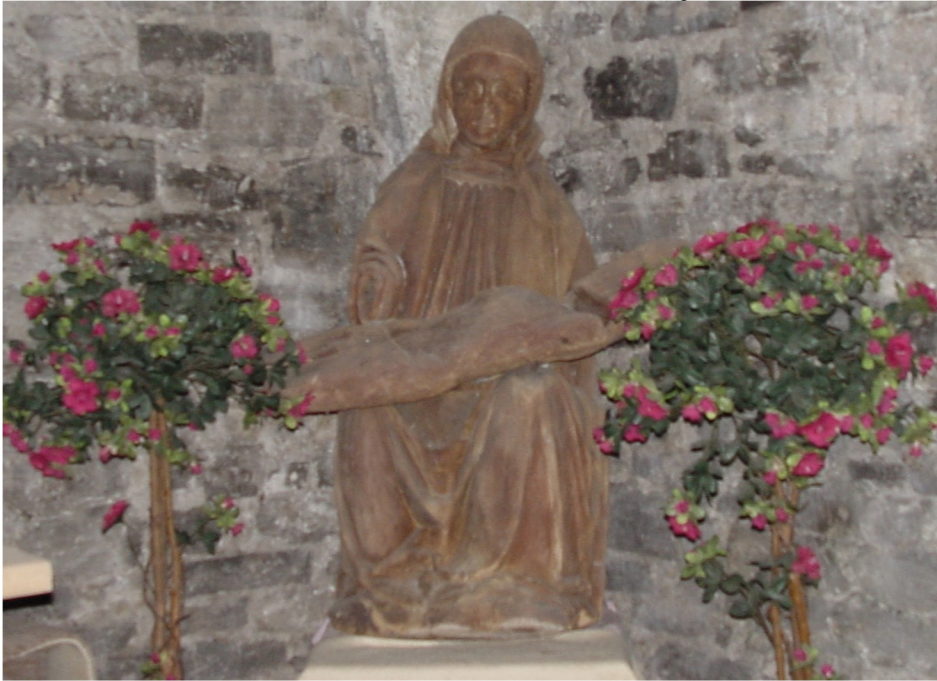
Pieta um 1500