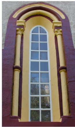
Mittleres Chorfenster mit Säulenvorlage