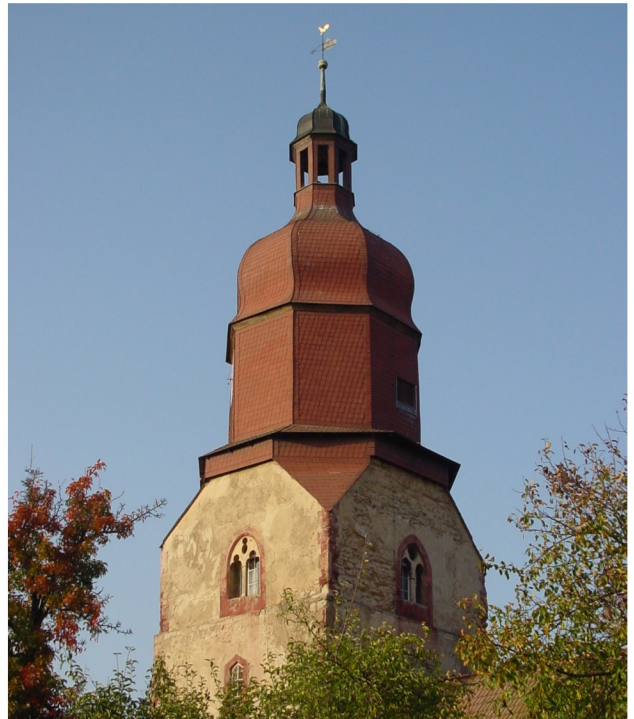
Westturm 36 m hoch mit welscher Haube