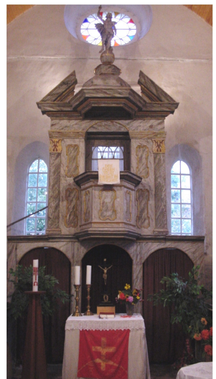
Kanzelaltar um 1700

Turm: Länge 7 m, Breite 8 m, Höhe 36 m Turmhöhe / Kirchenlänge = 1,32