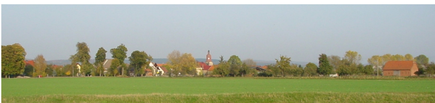
Ortsansicht von Südwesten