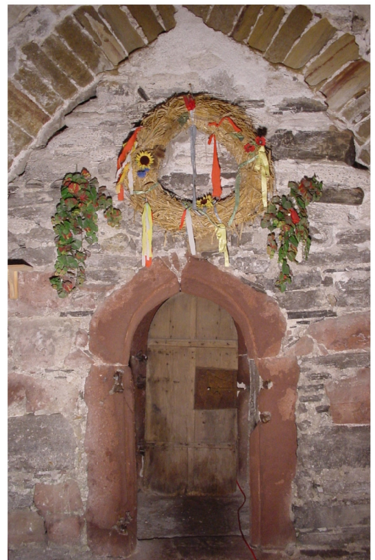
Turmerdgeschoß mit Kreuzradgewölbe