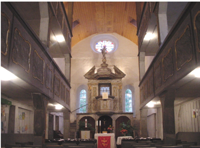
Innenansicht Richtung Chor