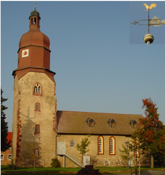
Kirchenansicht von Süden