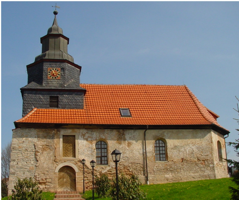
Kirchenansicht von Süden