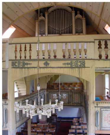
Innenansicht in Richtung Kirchenschiff