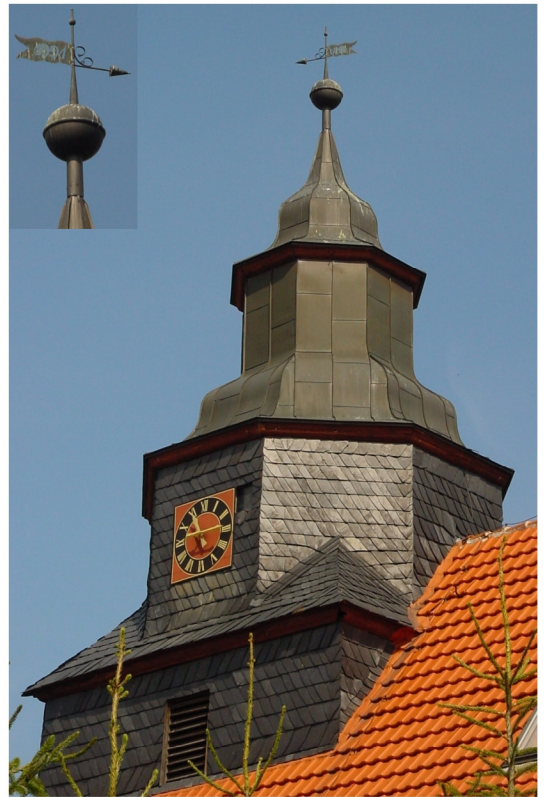
Westdachreiterturm 13 m hoch