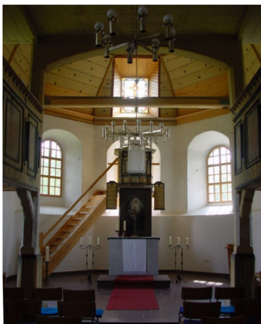
Innenansicht in Richtung Chor