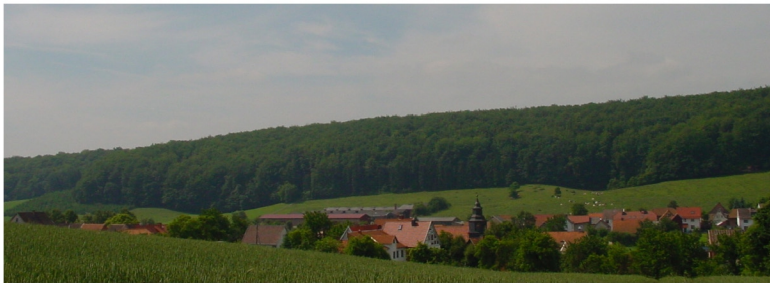
Ortsansicht von Nordwesten