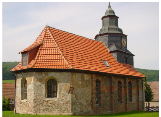
Kirchenansicht von Nordosten