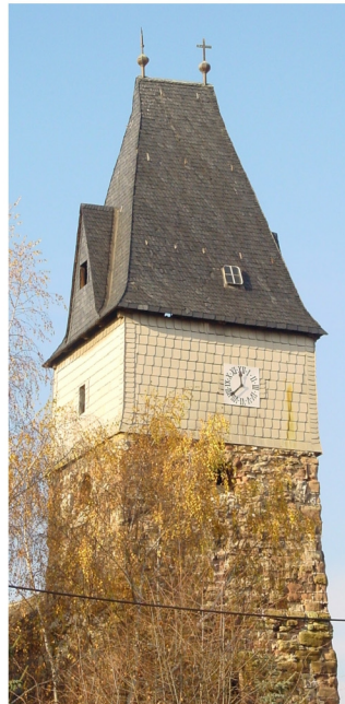
Ostchorturm 24 m hoch