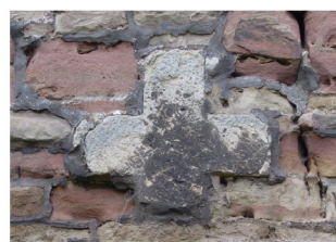
Steinkreuz in der Ostaußenwand