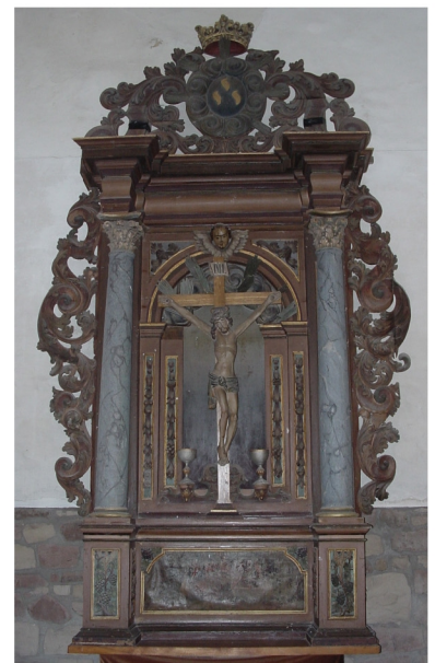
Barocker Altar mit Kruzifix