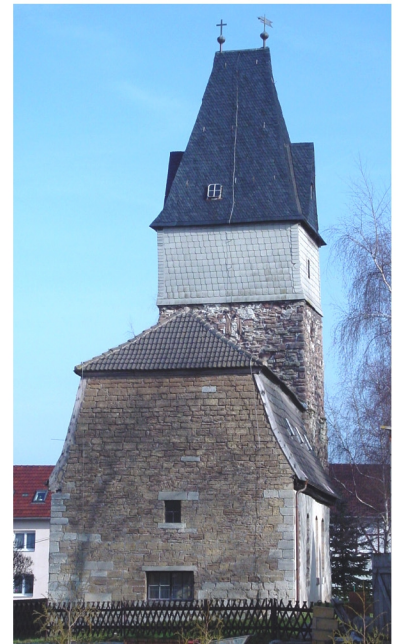
Kirchenansicht von Westen