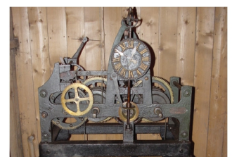
Uhrwerk für Turmuhr