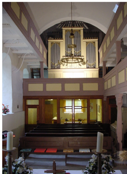
Innenansicht Richtung Kirchenschiff