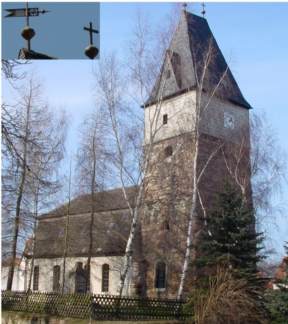
Kirchenansicht von Südosten