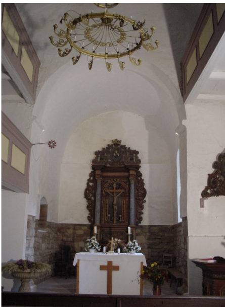
Innenansicht Richtung Chor