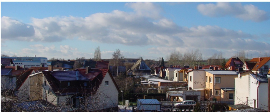
Ortsansicht von Osten