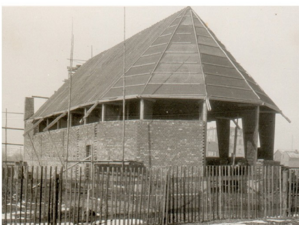
Baufoto vom 03. März 1950 (hängt in der Kirche)