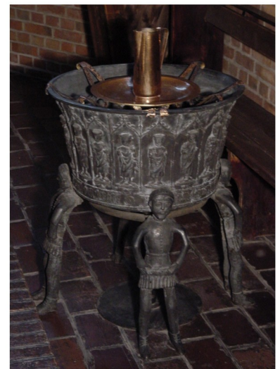
Taufkessel von 1429 aus der Petri-Kirche