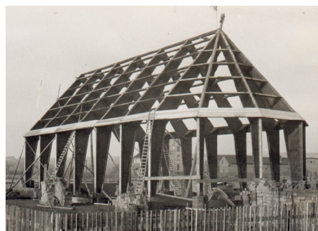
Baufoto vom 12. Dezember 1949 (hängt in Kirche)