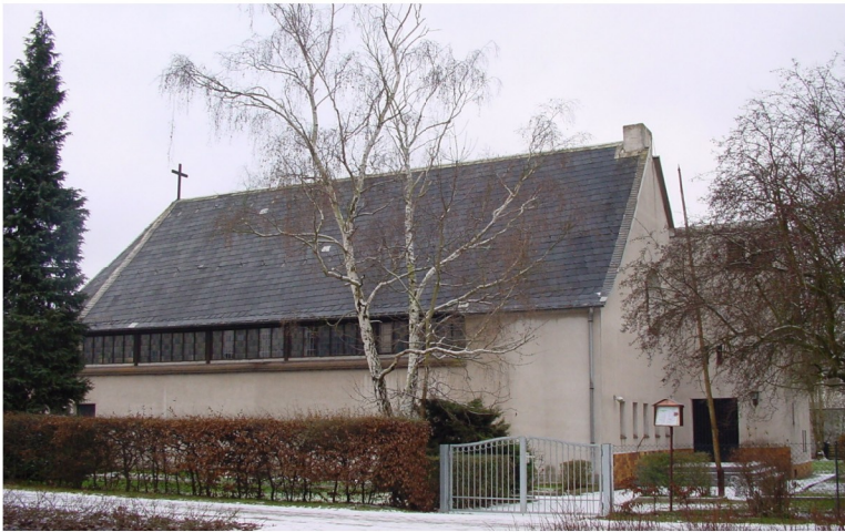
Kirchenansicht von Norden