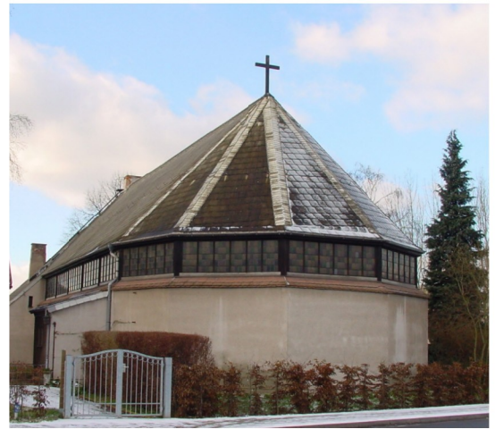
Kirchenansicht von Osten