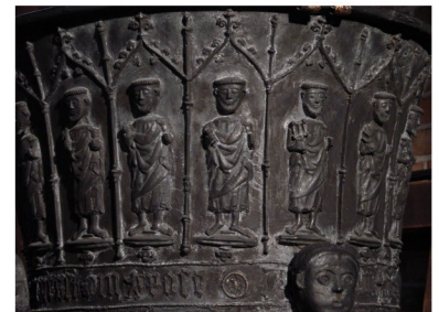
Taufbecken, Figuren am Bronzekessel