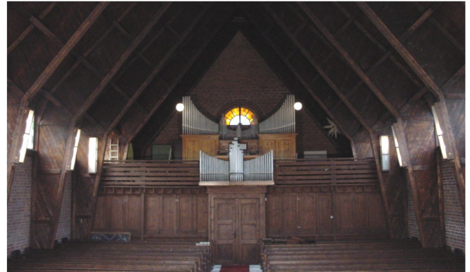
Innenansicht Richtung Kirchenschiff