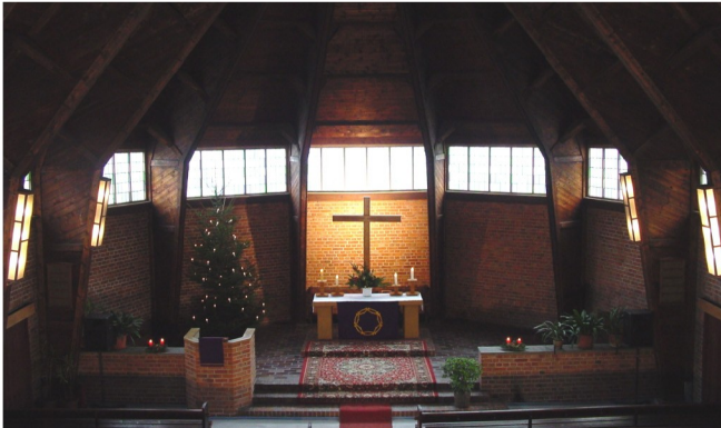
Innenansicht Richtung Chor