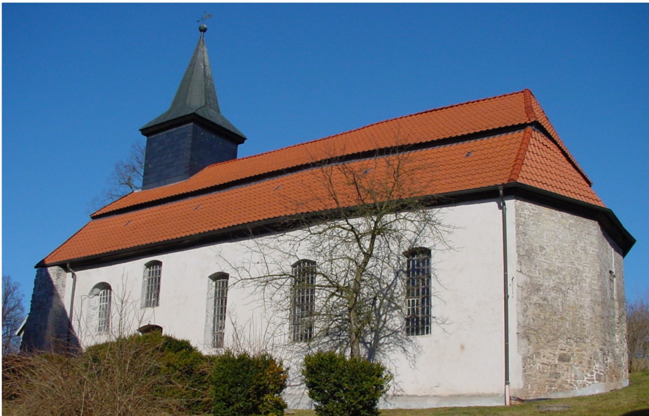
Kirchenansicht von Südosten