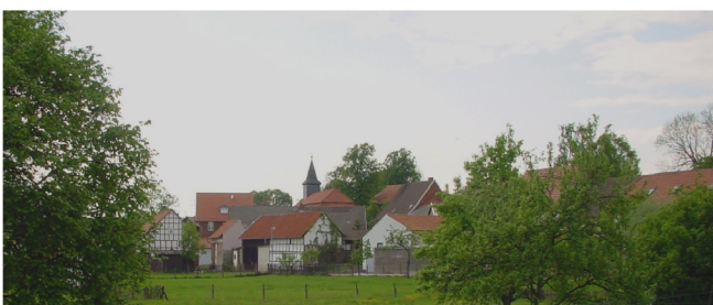
Ortsansicht von Osten