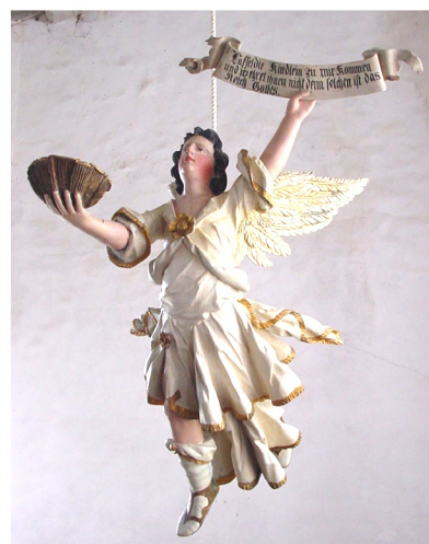
Taufengel Mitte 18. Jh.