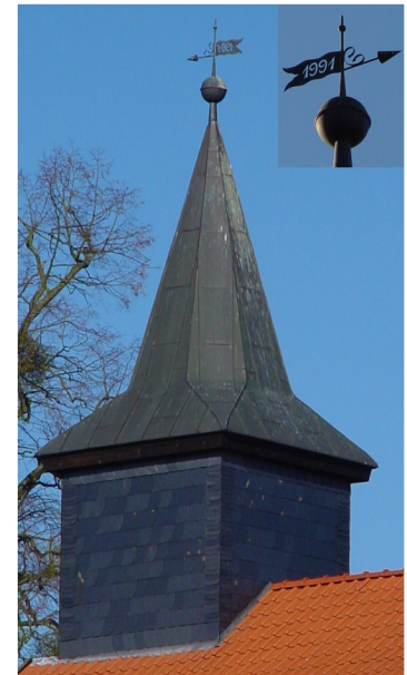
Westdachreiter 16 m