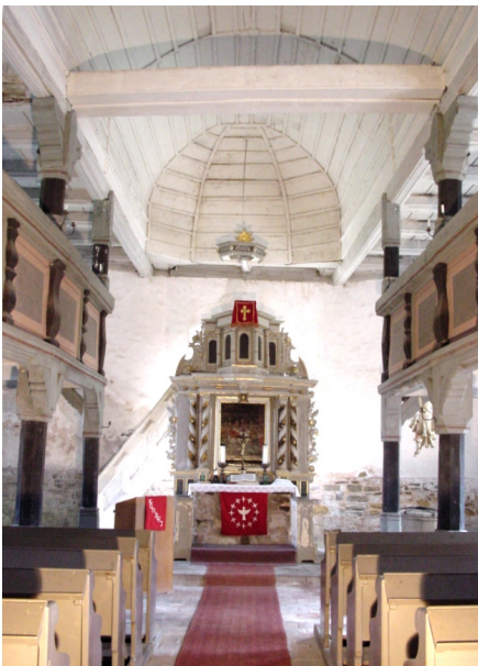
Innenansicht Richtung Chor