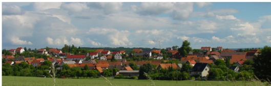
Ortsansicht von Norden