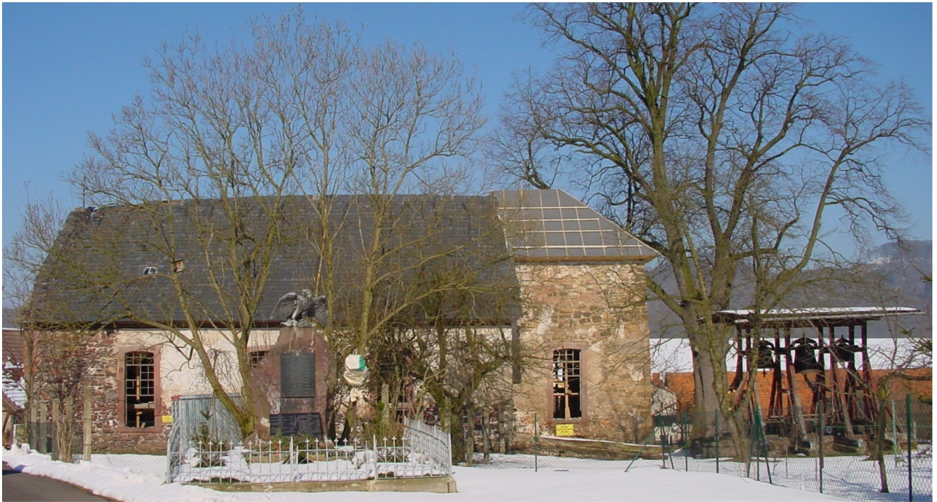
Kirchenansicht von Süden