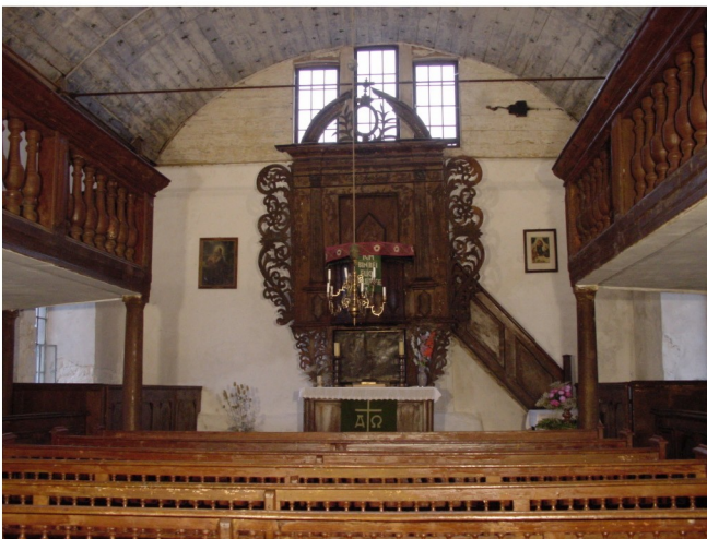
Innenansicht Richtung Chor