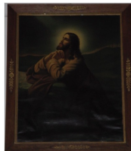
Bild an der Chorwand