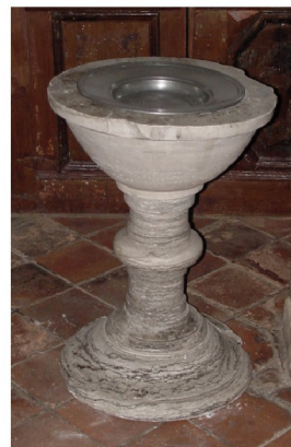
Taufstein von 1758, aus Gipsstein

Turm: Länge 6,5 m, Breite 7 m, Höhe 18 m Turmhöhe / Kirchenlänge = 0,82