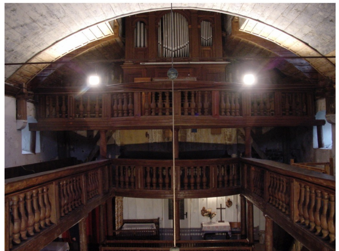
Innenansicht Richtung Kirchenschiff