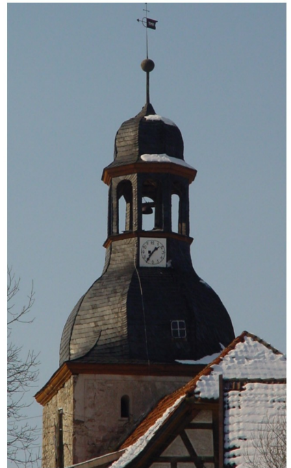
Westturm 18 m hoch mit welscher Haube