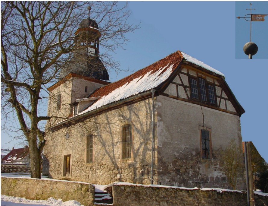
Kirchenansicht von Südosten