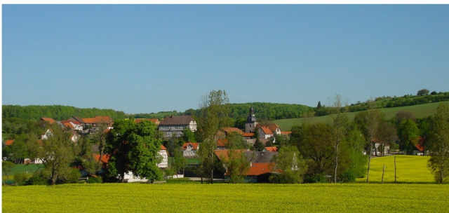
Ortsansicht von Süden