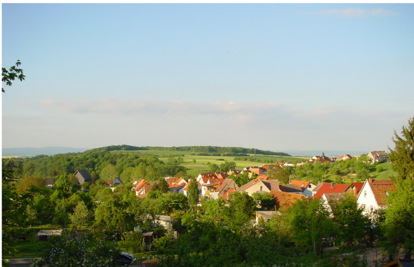
Ortsansicht von Südwesten