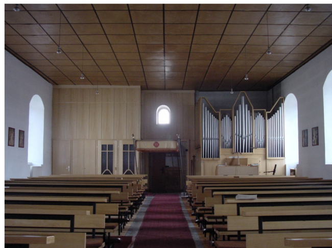
Innenansicht Richtung Kirchenschiff