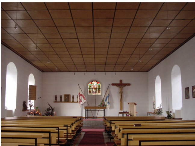
Innenansicht Richtung Chor