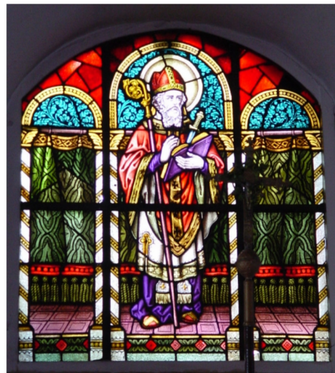
Chorfenster, heiliger Bonifatius