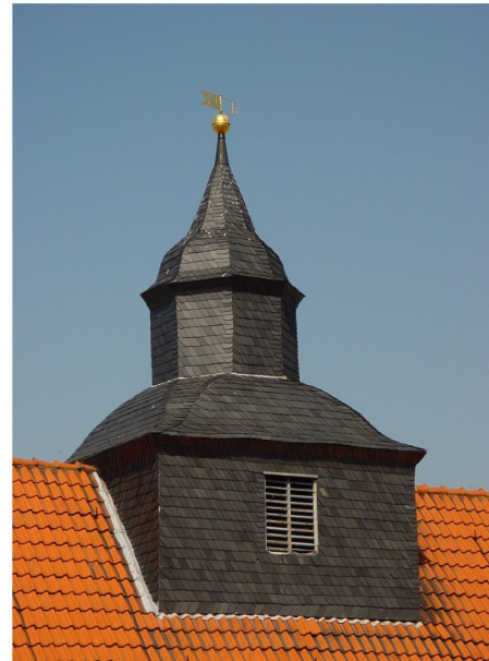
Dachreiterturm 14 m hoch