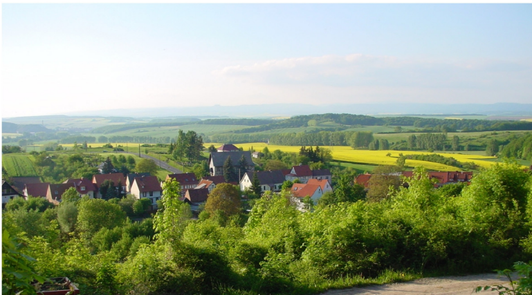
Ortsansicht von Südosten