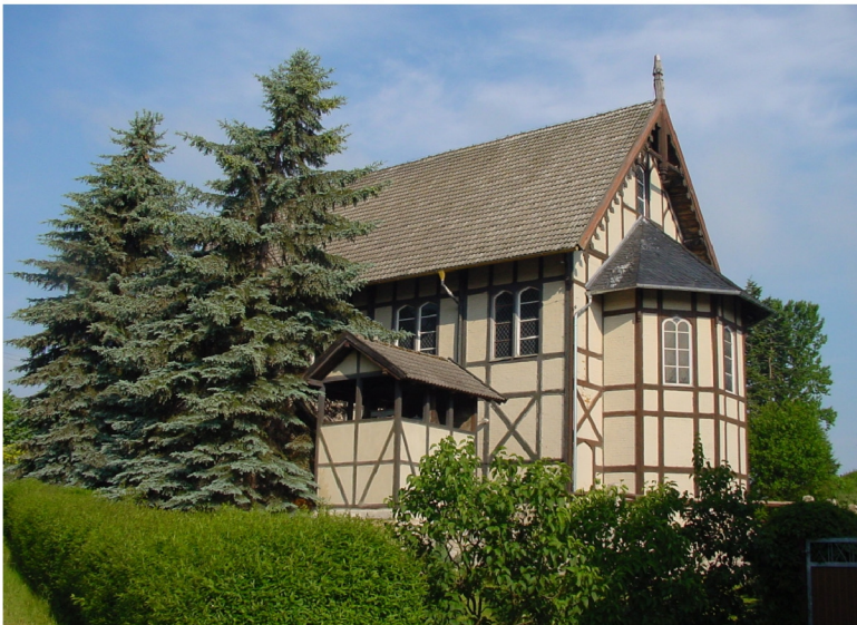
Kirchenansicht von Osten