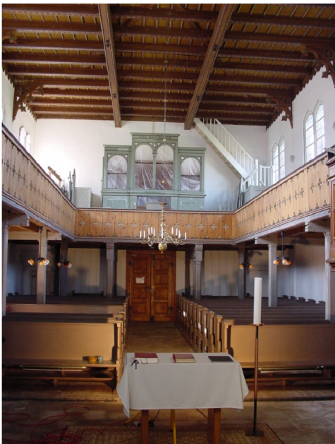
Innenansicht in Richtung Kirchenschiff