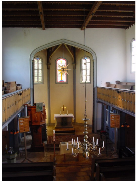
Innenansicht in Richtung Chor