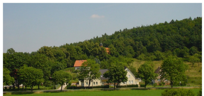
Ortsansicht von Südwesten

Turm: Länge 3 m, Breite 3 m, Höhe 13 m Turmhöhe / Kirchenlänge = 0,68