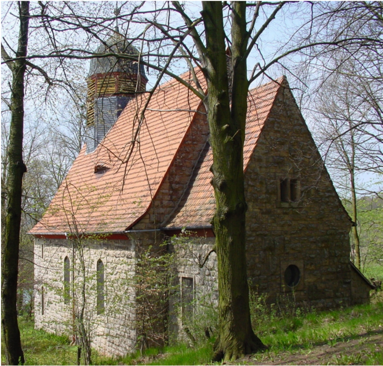
Kirchenansicht von Südosten