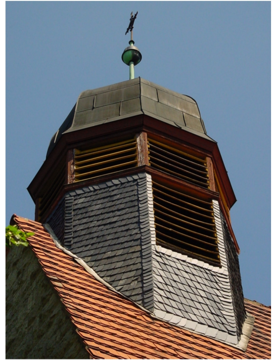
Westdachreiterturnm 13 m hoch