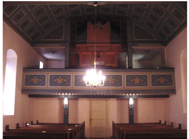
Innenansicht in Richtung Kirchenschiff